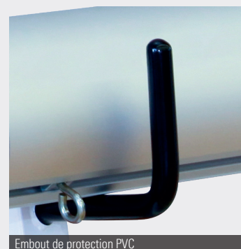
Embout de protection PVC